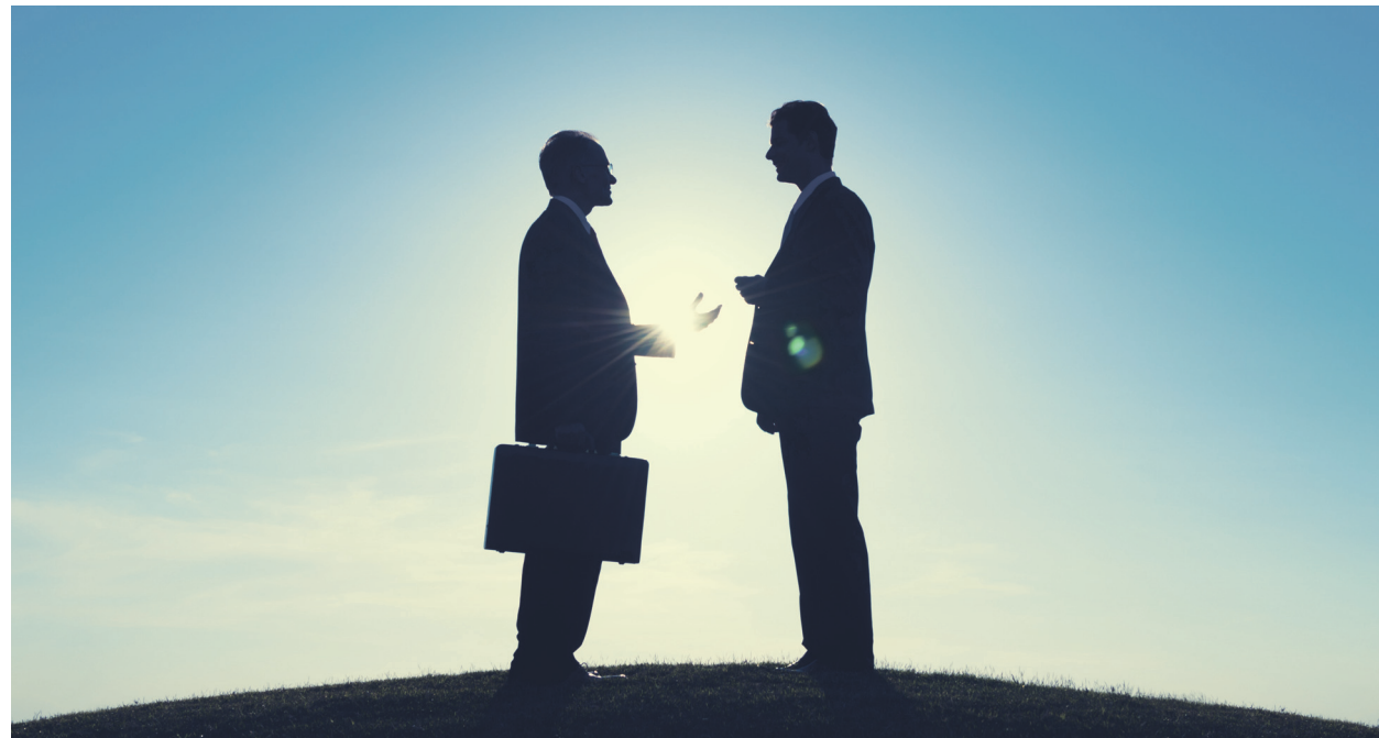
Pri významných transakciách živnostníci vedú len skrátenú dokumentáciu.

Transferové oceňovanie má zabrániť takým transakciám,